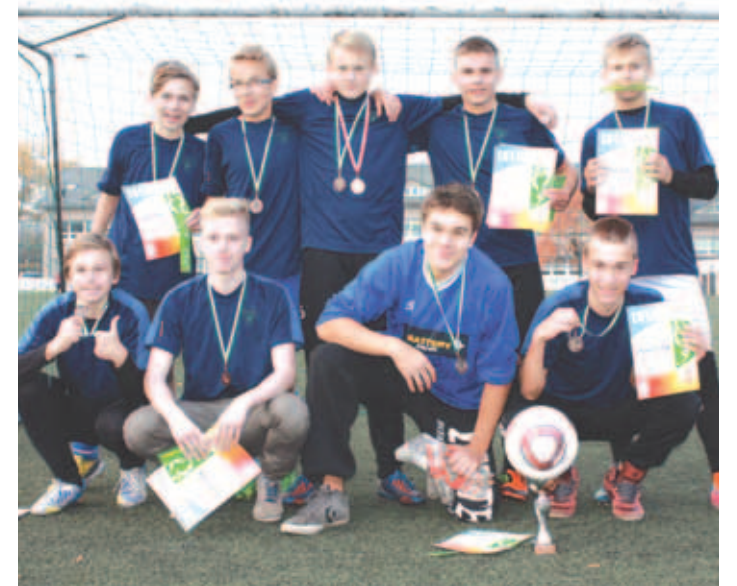
Pingeliselt turniirilt naasid Loo Keskkoooli õpilased uute kogemuste ja auväärt kolmanda kohaga.