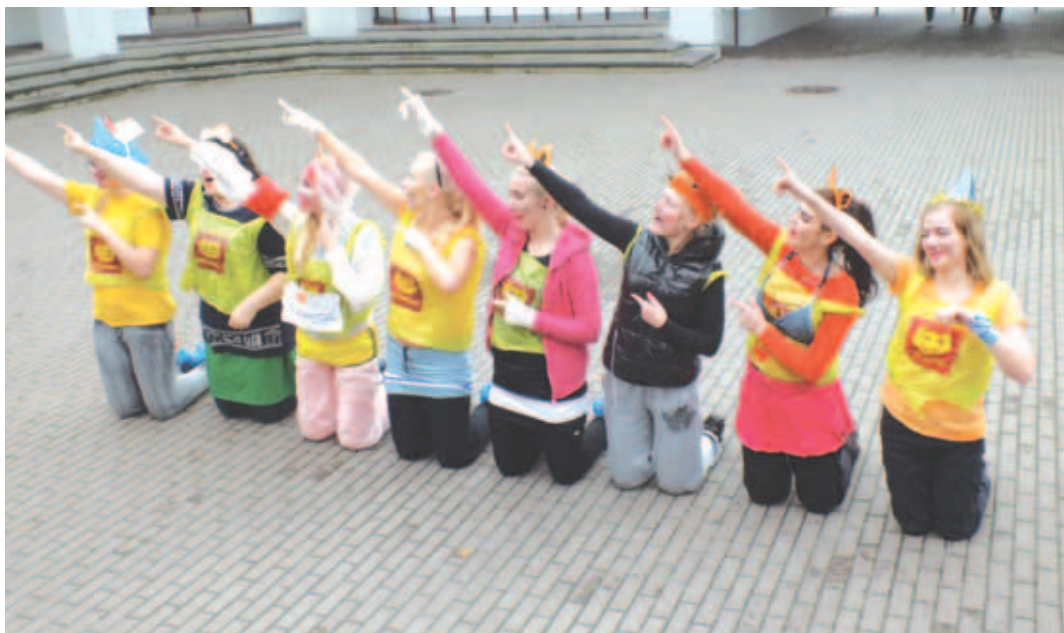
Rebaste peavad sooritama pealtnäha veidraid ülesandeid.

Eelnimetatud punktid olid esindatud ka meie korraldatud päeval. Hommik algas kogunemisega staadionil, kus rebased said aru, et see päev ei saa meelakkumine olema. Nad said esimese kivi meiki ja riided, millega igapäevaselt ei käiks.