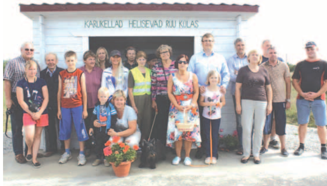
Augustikuu viimasel päeval valmis Ruu külas kohalike elanike eestvedamisel loodud bussiootepaviljon, mis kaitseb Ruu, Neeme ja Ihasalu lapsi vihma ja lume eest. Erikselt teeb bussipeatuse see, et kohati hiliste õhtutundideni ehitustöödel osalesid pea kõik Ruu elanikud.