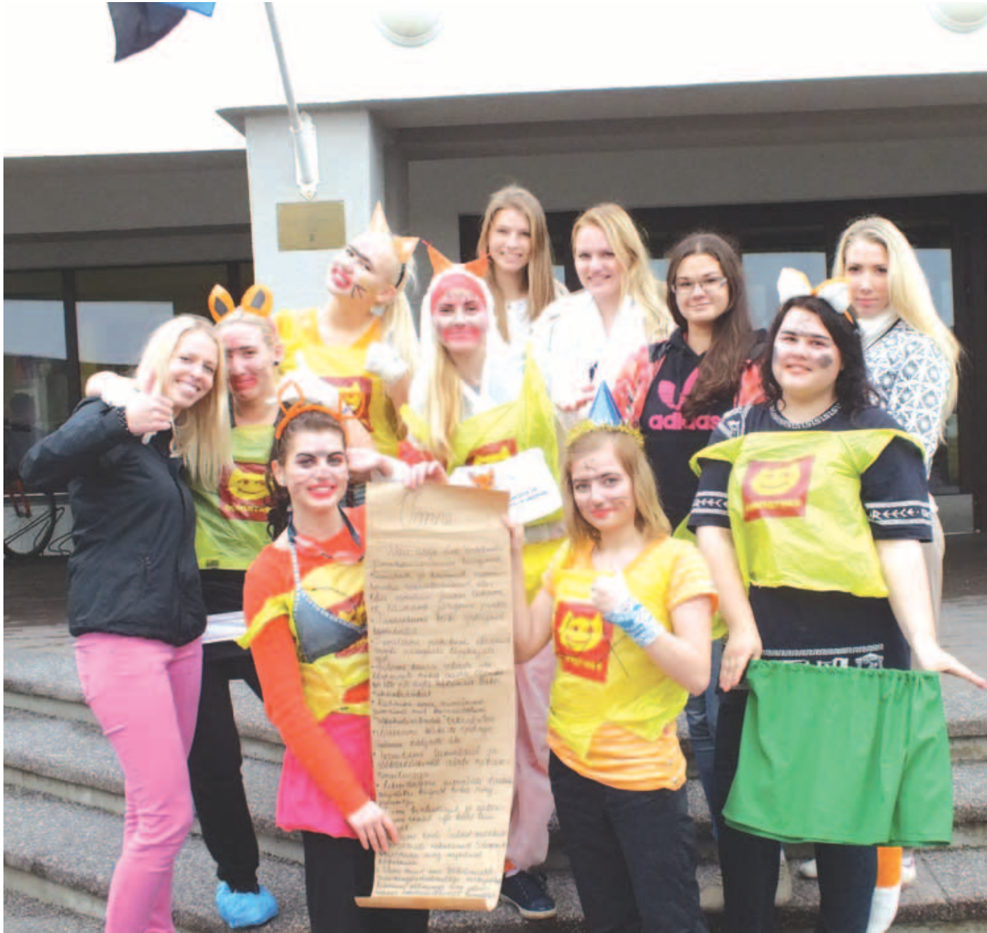
Pärast traditsioonilise vande ettelugemist said rebastest gümnaasiumipere ametlikud liikmed.