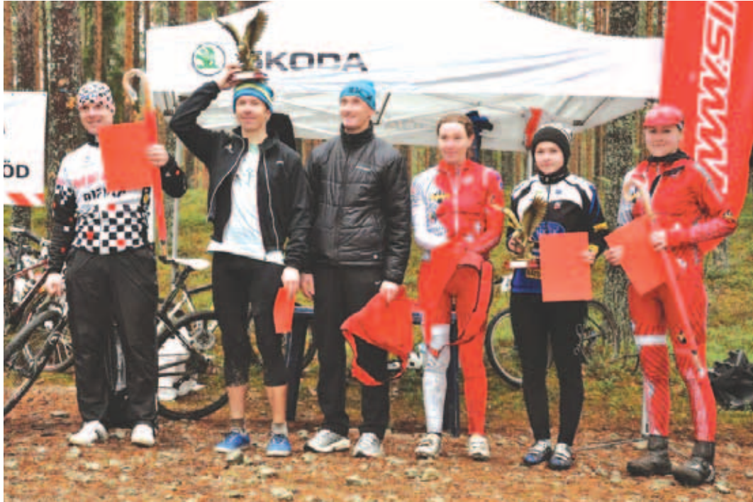
Ürituse läbiviijad pälvisid hea korralduse ja põneva rajavaliku eest vaid kiidusõnu.

Jõelähtme Singel tänab kõiki hooaja lõpuvõistlusel osalejaid ja ootame teid uutel sõitudel 2014. aastal. Jõelähtme VIII Rattamaraton toimub 14. juunil 2014.