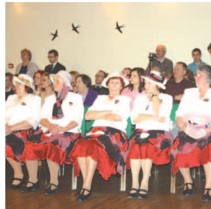
Loo aleviku senioride klubi Pihlakobar.